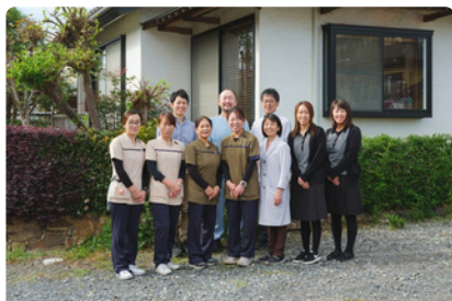
在宅チームで対応いたします